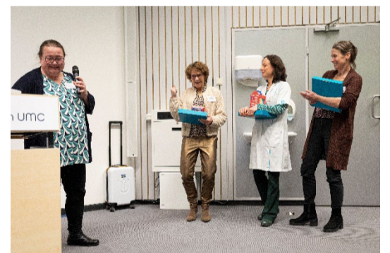
Uitreiking Jaarprijs Impact

'Sterven en rouwen op de intensive care (STRIC)' van Erasmus MC en Hogeschool Rotterdam.