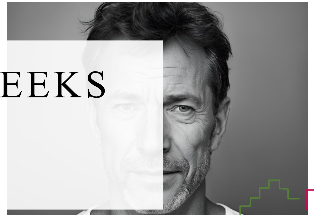
FOTO VERHALEN REEKS

VAN VERBORGEN NAAR ZICHTBARE KRACHT VAN PALLIATIEVE ZORG